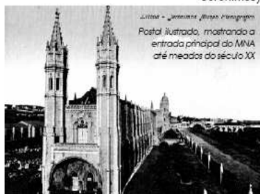
Lisboa - Jerónimos, Museu Nacional de Arqueologia Postal ilustrado, mostrando a entrada principal do MNA até meados do século XX

(data da transferência, em 1903, e da abertura ao público, em 1906, do MNA no Mosteiro dos Jerónimos)