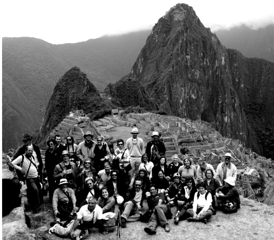
Foto do grupo, com Machu Picchu em fundo.

Directora do Museu Nacional do Traje Presidente da AG da APOM