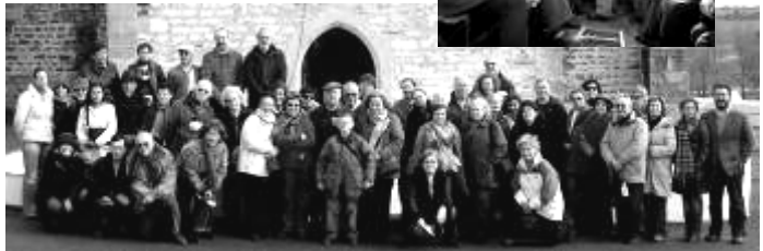
No Santuário da Sra. da Boa Nova (Terena) e no caminho para o Santuário de Endovélico (S. Miguel da Mota), ambos no Alandroal