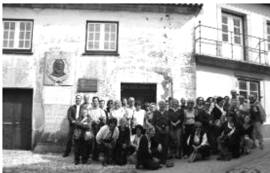
Em Ucanha, junto à casa onde nasceu Leite de Vasconcelos.