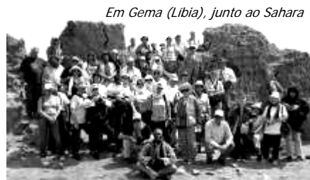
Em Gema (Líbia), junto ao Sahara