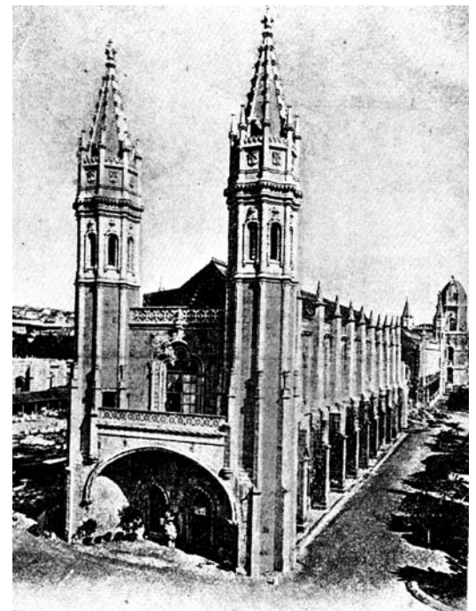
Entrada original do MNA, por onde desde 1963 se faz a entrada do Museu de Marinha. De notar o derrube da torre central (actual entrada do MNA) e a não construção das alas poente e norte do plano oitocentista, actualmente ocupadas pelo Museu de Marinha, mas inicialmente destinadas ao MNA.

Apesar do inchaço das pernas e da falta de pés, corexei a batalhar para que não me desalojem da Praça do Império.