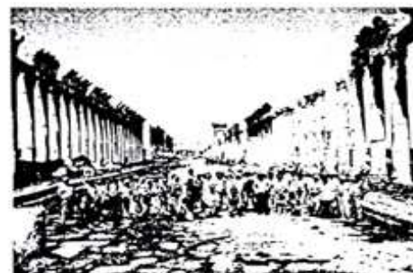
3: Viagem à Síria: em cima, o grupo no pátio central do Palácio de Ugarit; em baixo, o grupo na longa alameda correspondente ao principal eixo viário da cidade romana de Apamea

No último ano, as actividades do GAMNA continuaram a processar-se a bom ritmo.