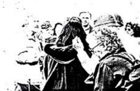
1: Viagem Ao Algarve e Alentejo: em cima, Milreu; ao meio, Tavira; em baixo, Mértola.